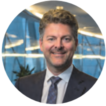
Dr. Andreas Schwab

Mitglied des europäischen Parlaments, Brüssel