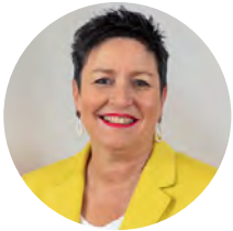
Daniela Schneeberger Nationalrätin Präsidentin SSC